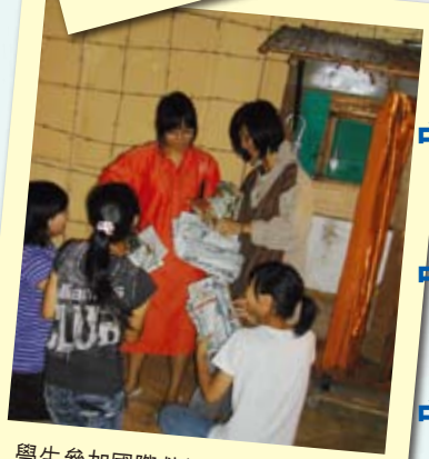
學生參加國際救援機構學習活動。