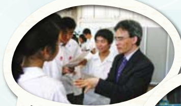
校長也來支持參與英語日活動