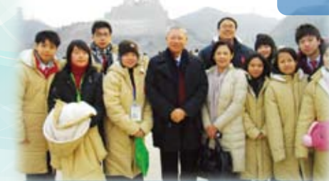
本校參加「薪火相傳-中華文化探索與承傳」學習團，與教育局局長孫明揚先生及副秘書長陳嘉琪博士於炎黃二帝像前留影。