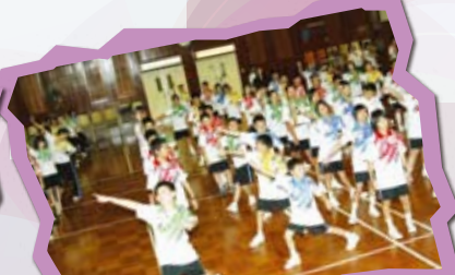
中一新生體藝才能測試—發掘學生潛能及興趣，為新高中學制的「其他學習經歷」作準備。