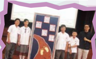
參加「共創成長路」計劃，幫助學生健康成長。