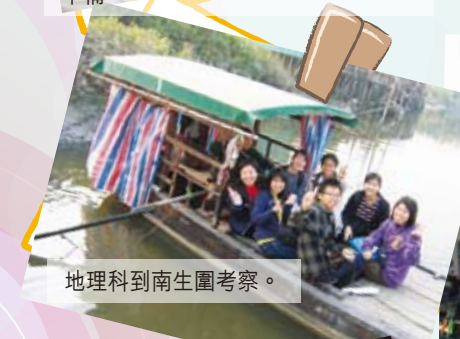
地理科到南生圍考察。