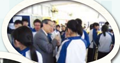
校董也來支持參與英語日活動