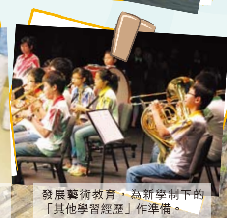
發展藝術教育，為新學制下的「其他學習經歷」作準備。