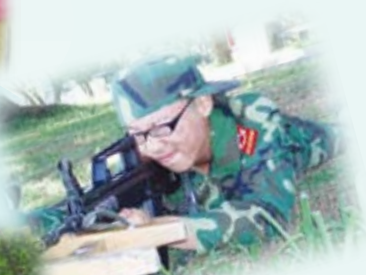
學生參與「青少年軍事夏令營」