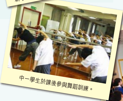
中一學生於課後參與舞蹈訓練。