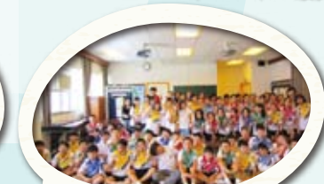
為小六升中一之學生舉辦英語銜接課程