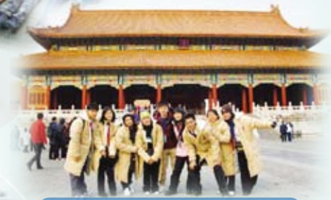
本校參加「薪火相傳-中華文化探索與承傳」學習團，學生攝於北京。