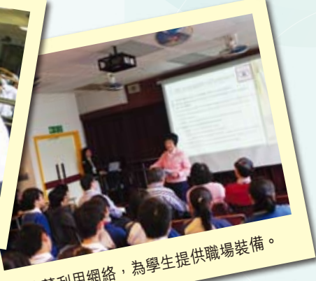
校董利用網絡，為學生提供職場裝備。