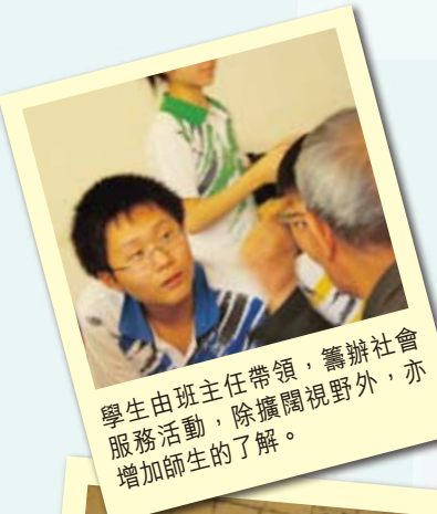
學生由班主任帶領，籌辦社會服務活動，除擴闊視野外，亦增加師生的了解。