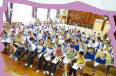
為中一學生設計價值教育活動—透過「和諧校園」及「護蛋行動」計劃，以討論、體驗及實踐方式，幫助中一學生掌握「關愛」、「尊重」及「珍惜」等正確價值觀。