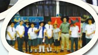
於不同節日舉辦英語活動 - 萬聖節