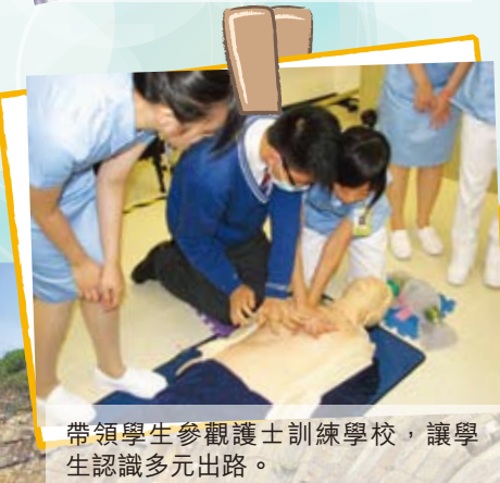
帶領學生參觀護士訓練學校，讓學生認識多元出路。