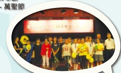
中一、中二級英語話劇比賽