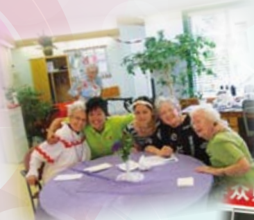
學生獲選「香港學生大使」，到加拿大進行文化交流。