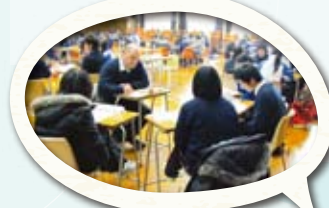
聯校中七級英語會話訓練