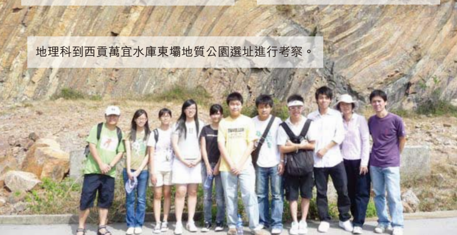
地理科到西貢萬宜水庫東壩地質公園選址進行考察。