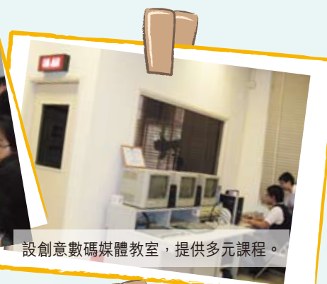
設創意數碼媒體教室，提供多元課程。