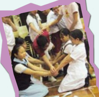
「愛與夢飛行」— 八月初新生參與學校社工及德育及公民教育組合辦的團隊協作活動。

學校為中一學生精心策劃各項適應及學習活動，期望讓學生在德、智、體、群、美各方面均有所進益。