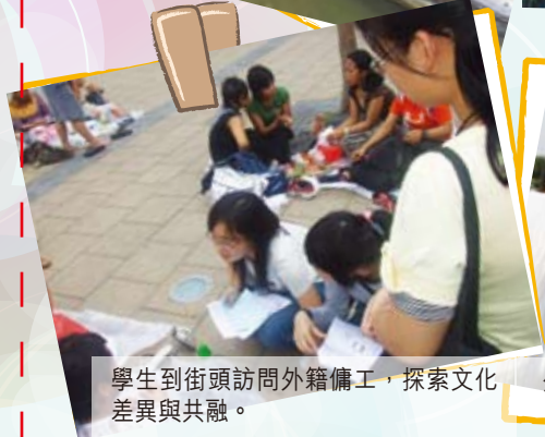
學生到街頭訪問外籍傭工，探索文化差異與共融。