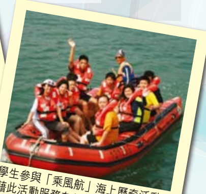
學生參與「乘風航」海上歷奇活動，藉此活動服務有特殊需要的小學生。