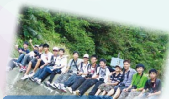
環保大使往臺灣參加生態交流團，於基隆市郊尋找河谷蝴蝶時留影。

本校向來鼓勵學生多作學術交流，近年推薦不少學生參與不同類型的交流活動，學生得以擴闊視野，獲益良多。