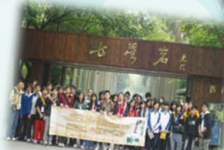
地理科及環保大使參加「同根同心-自然國情(地貌)考察」活動，往肇慶鼎湖山及七星岩考察。