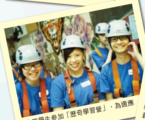
中四學生參加「歷奇學習營」，為適應新學段作準備。