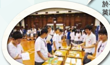
學生投入參與各項英語日活動