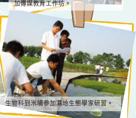
生物科到米埔參加濕地生態學家研習。