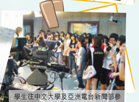
學生往中文大學及亞洲電台新聞部參加傳媒教育工作坊。