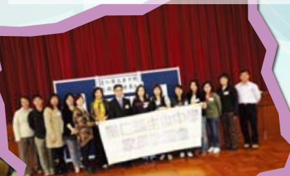
家校緊密聯絡—設雙班主任制，於八月、十月、二月及七月均設家長日，年中又舉辦黃昏家長教師茶聚，加強班主任與家長的溝通。