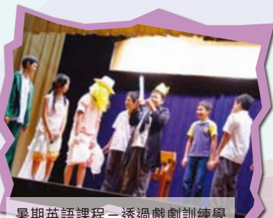
暑期英語課程—透過戲劇訓練學生提升學生使用英語的信心。