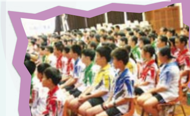
「校園SAR」— SUPPORT, ACTIVITIES AND RULES 訓育及學校支援服務專題講座。