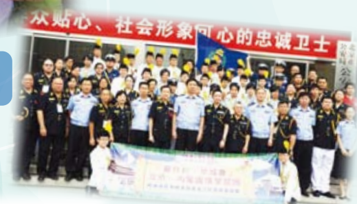
學生參加國情學習團往北京、內蒙