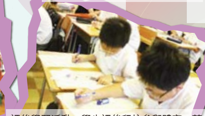
課後學習活動—學生課後留校參與體育、藝術、制服隊伍及其他各類活動，同時亦安排功課輔導及語文自學計劃等學術活動，提供學習支援。