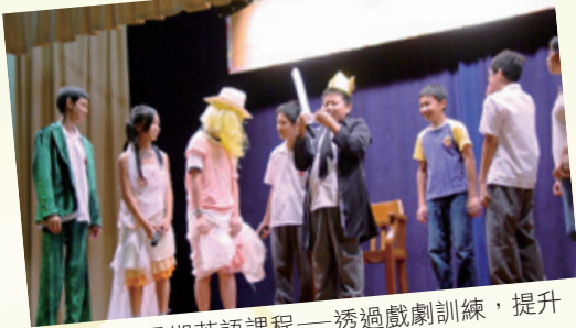
暑期英語課程——透過戲劇訓練，提升學生使用英語的信心。