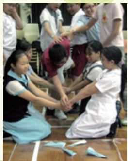
「愛與夢飛行」——八月初新生參與學校社工和德育及公民教育組合辦的團隊協作活動。

學校為中一學生精心策劃各項適應及學習活動，期望讓學生在德、智、體、群、美各方面均有所進益。