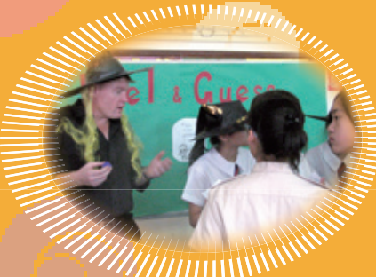
外籍老師舉行英語活動，甚受學生歡迎