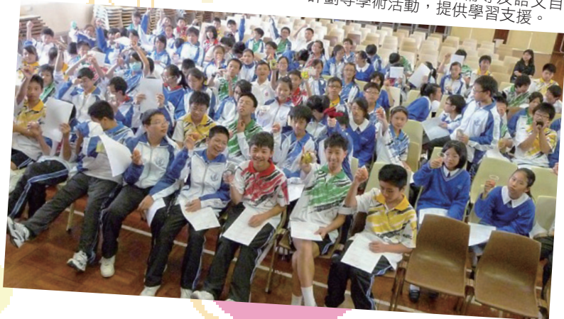
為中一學生設計價值教育活動——透過「和諧校園」及「護蛋行動」計劃，以討論、體驗及實踐方式，幫助中一學生掌握「關愛」、「尊重」及「珍惜」等正確價值觀。