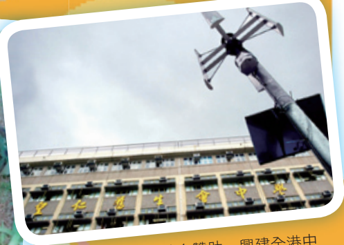
得到港燈清新能源基金資助，興建全港中學第一部垂直式風力發電機組，機組不但為本校學生提供研習可再生能源的平台，更為其他中小學提供研習及交流的機會。