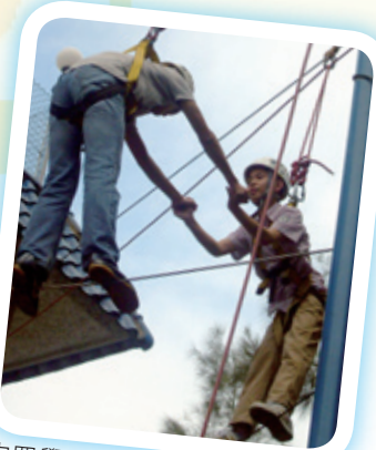
中四學生參加「歷奇學習營」，為適應新學段作準備。