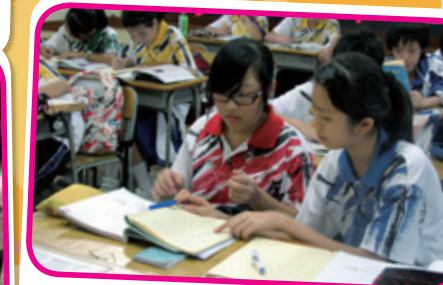
由老師及學長帶領的功課輔導班，為新學制的學生提供課後學習支援。