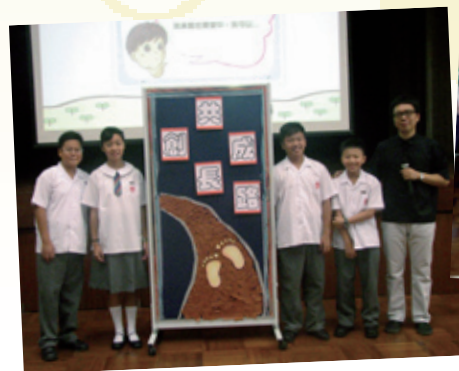
參加「共創成長路」計劃，幫助學生健康成長。