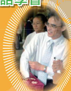
英語日——校長也來支持英語活動