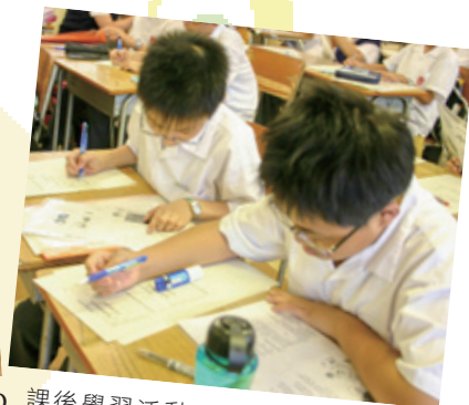
課後學習活動——學生課後留校參與體育、藝術、制服隊伍及其他各類活動，同時亦安排功課輔導及語文自學計劃等學術活動，提供學習支援。