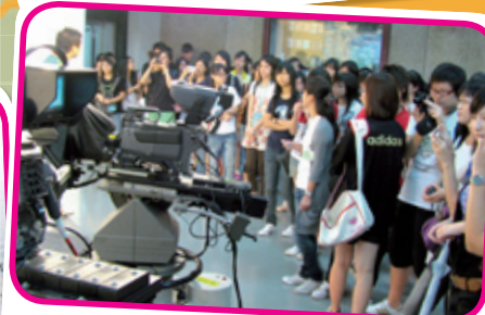
學生往中文大學及亞洲電視台新聞部參加傳媒教育工作坊。