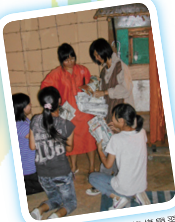
學生參加國際救援機構學習活動。