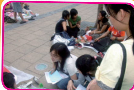
學生到街頭訪問外籍傭工，探索文化差異與共融。