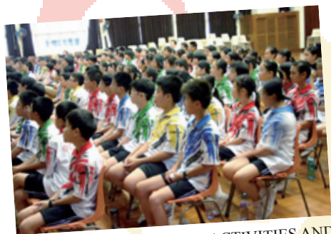
「校園SAR」——SUPPORT, ACTIVITIES AND RULES 訓育及學校支援服務專題講座。