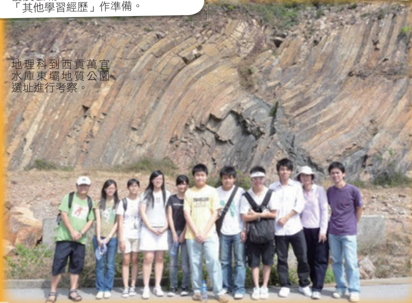
地理科到西貢萬宜水庫東壩地質公園選址進行考察。