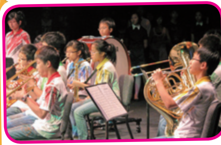
發展藝術教育，為新學制下的「其他學習經歷」作準備。