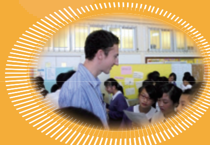
學生樂於與年青外籍導師以英語暢談