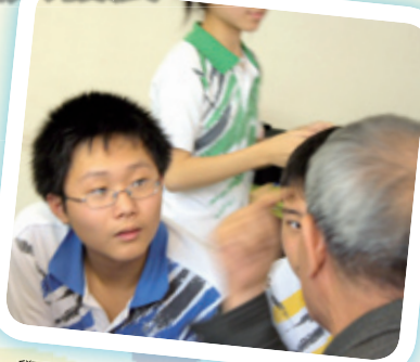
學生由班主任帶領，籌辦社會服務活動，除擴闊視野外，亦增加師生互相的了解。