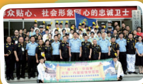
學生往北京、內蒙參加國情學習團