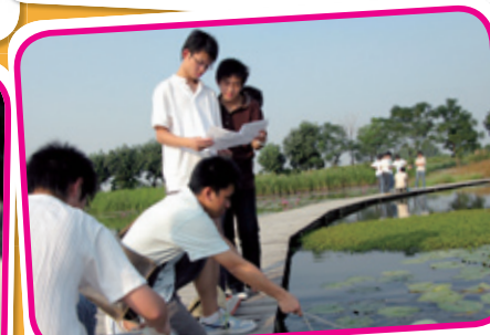
生物科到米埔參加濕地生態學家研習。