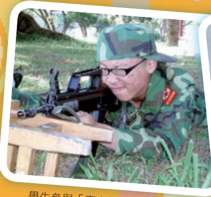
學生參與「青少年軍事夏令營」