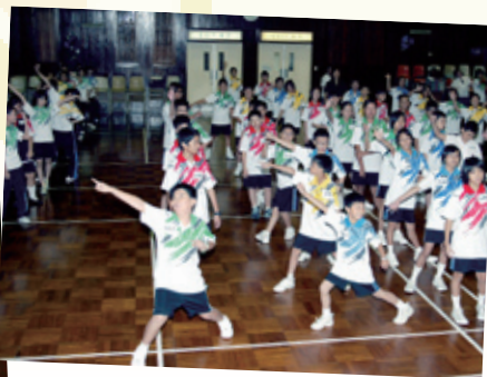
中一新生體藝才能測試——發掘學生潛能及興趣，為新高中學制的「其他學習經歷」作準備。