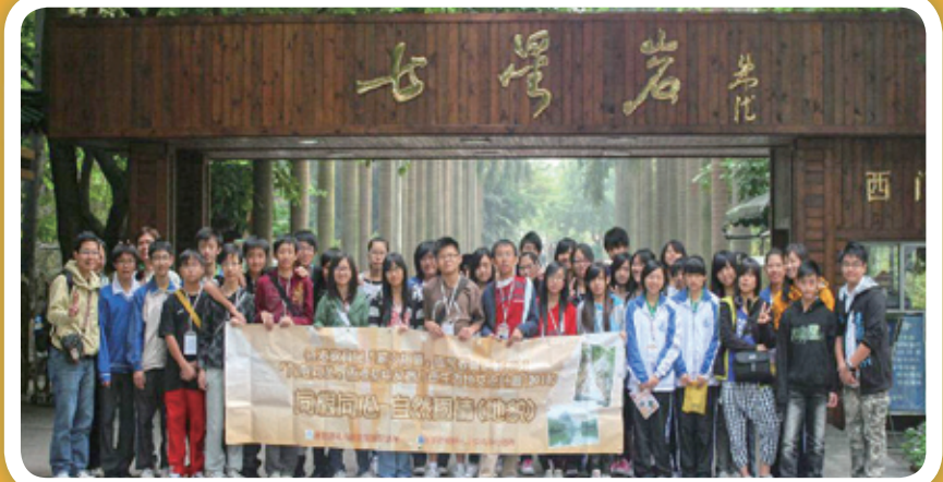
地理科及環保大使參加「同根同心-自然國情(地貌)考察」活動，往肇慶鼎湖山及七星岩考察。