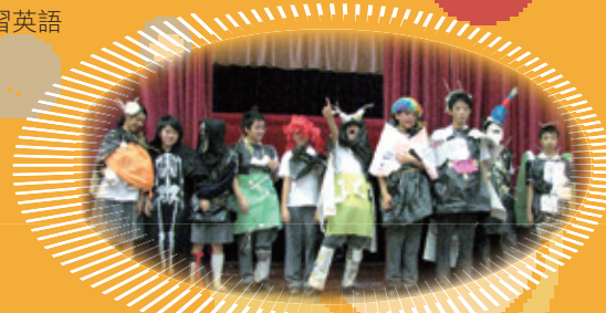
同學投入午間英語活動