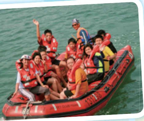
學生參與「乘風航」海上歷奇活動，藉此活動服務有特殊需要的小學生。