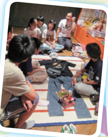
德育及公民教育組往樂施會作專題研習。