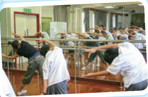
中一學生於課後參與舞蹈訓練。