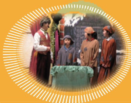
利用戲劇學習英語