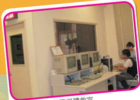
創意數碼媒體教室