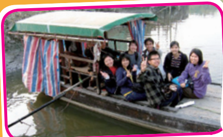
地理科到南生圍考察。