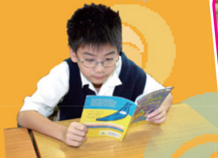
透過跨科組專題研習，有效提升學生閱讀興趣和理解能力