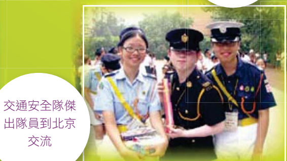
交通安全隊傑 出隊員到北京 交流