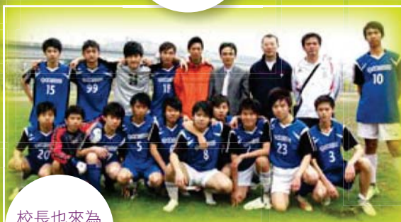
校長也來為 足球隊打氣