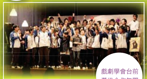
戲劇學會台前 幕後合作無間