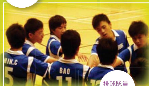
排球隊員 商議戰略