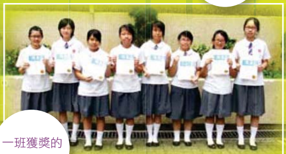
一班獲獎的 小作家