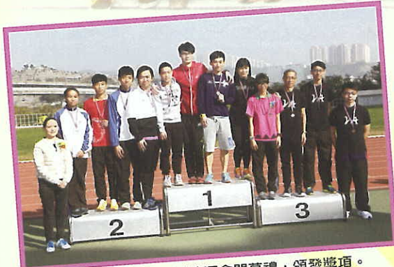
本會委員出席學校陸運會閉幕禮，頒發獎項。