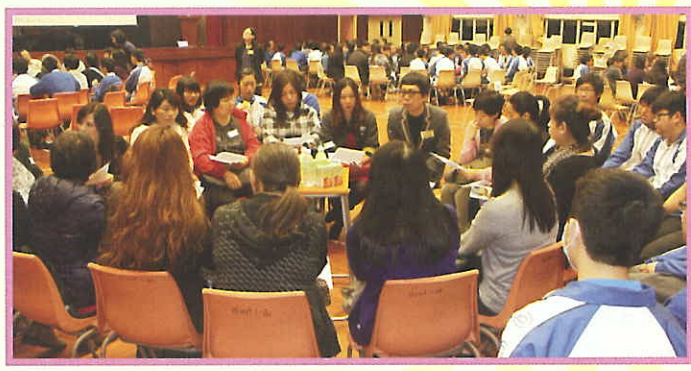
中三班主任與家長及同學濟濟一堂，分享選科心得