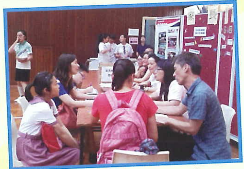
於中一新生註冊日鼓勵家長入會