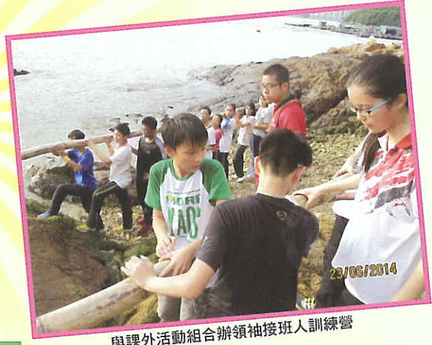
與課外活動組合辦領袖接班人訓練營