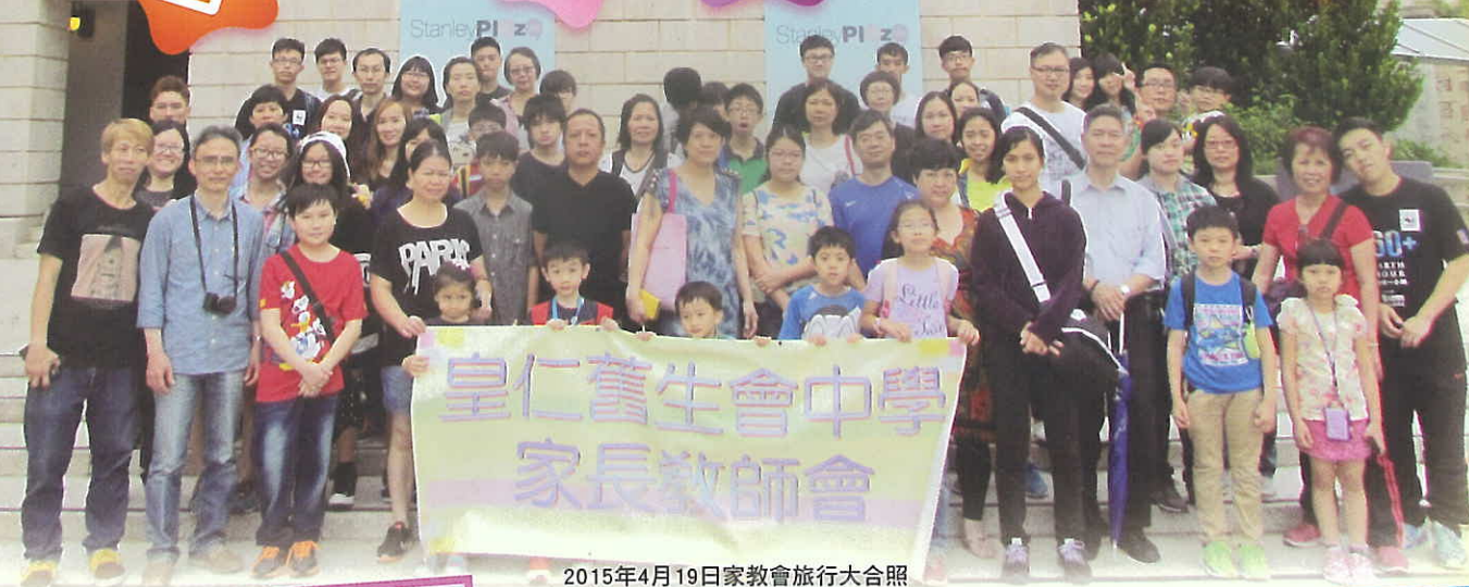
2015年4月19日家教會旅行大合照