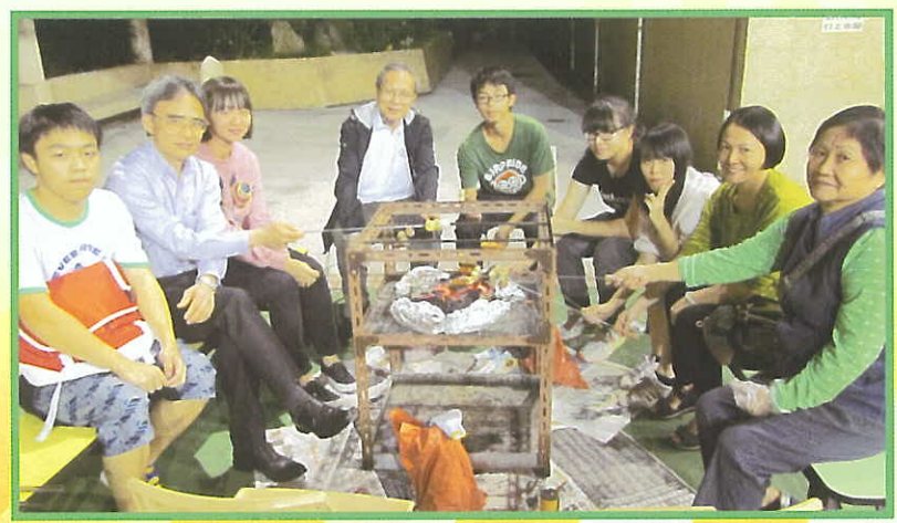
校董、校長、家長及同學齊齊參與2014年11月22日親子黃昏校園燒烤