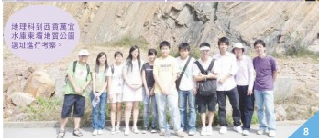
地理科到西貢萬宜水庫東端地質公園選址進行考察。