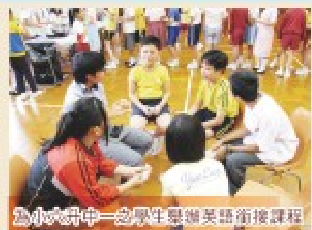
為小六升中一之學生舉辦英語銜接課程