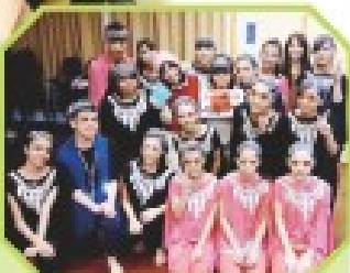
舞蹈校隊於葵青區舞蹈比賽中獲金獎。