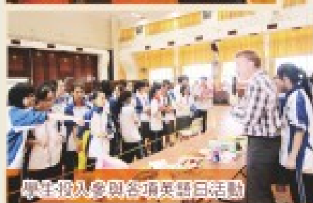
學生皆能參與各項英語日活動