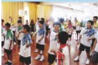
中一新生才藝測試