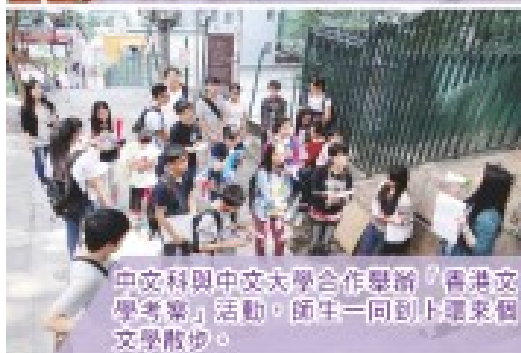
中文科與中文大學合作舉辦「香港文學考察」活動，師生一同到上環來個文學散步。