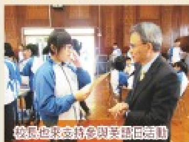
校長也來支持參與英語日活動