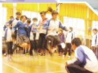
體育科舉行班際跳繩比賽，同學皆玩得不亦樂乎。