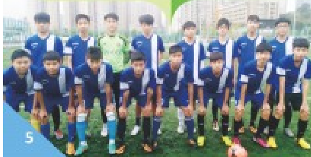
本校男乙足球校隊勇奪「香港學界體育總會葵青區足球比賽」男乙第一組冠軍。