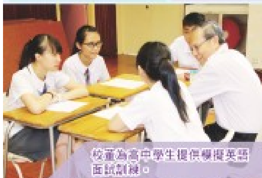
校董為高中學生提供優異英語面試訓練。