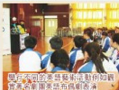
舉行不同的英語藝術活動例如觀賞著名劇團英語布偶劇表演