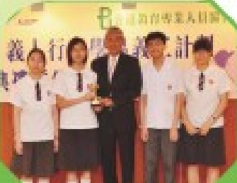
學生於永亨「義人行」學界義工計劃中獲傑出義工獎