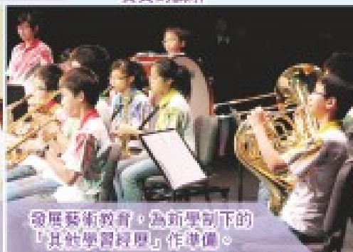
發展藝術教育，為新學制下的「其他學習經歷」作準備。