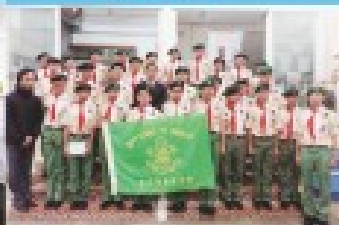
中一課後學習活動——制服隊伍