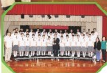
中文科於第六十五屆香港學校朗誦節勇奪中四級男女子集誦冠軍