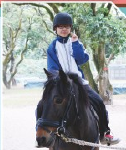
學生參觀專門騎術學校，並體驗策騎小馬之樂趣。