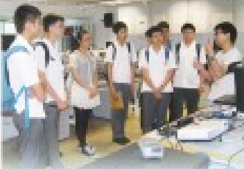
同學參觀香港浸會大學理學院開放日，專心聆聽專員的講解。