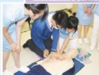
帶領學生參觀護士訓練學校，讓學生認識多元出路。