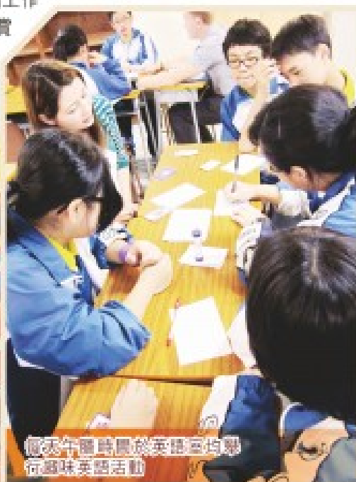
每天午間時段於英語室均舉行趣味英語活動