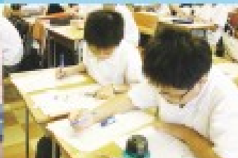
中一課後學習活動—— 英語基礎班（Back-to-Basics Programme）