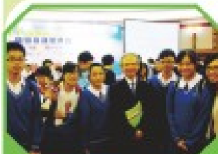
本校學生於明報校際專題報道比賽中獲得季軍，並與主禮嘉賓林煥光先生合照。