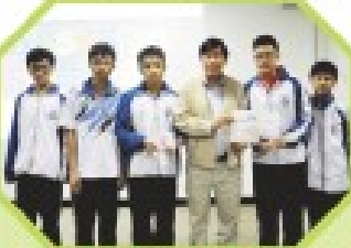
環保大使參加城市大學及海洋公園保育馬路暨計劃，獲區報分享冠軍。