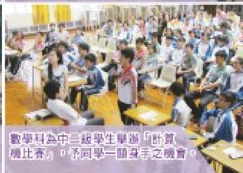
數學科為中三級學生舉辦「計算機比賽」，予同學一顯身手之機會。