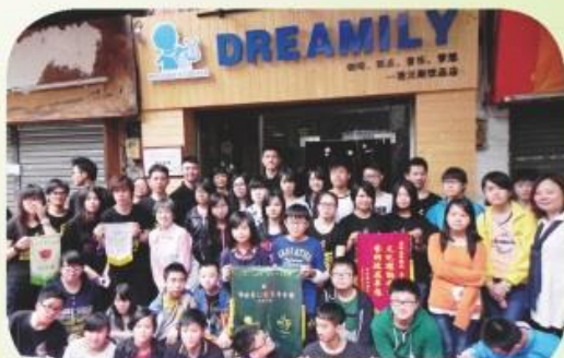
學生參加「躍動的音符」廣州音樂交流活動，與當地音樂團體交流心得。