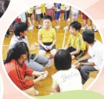
為小六升中一之學生舉辦英語銜接課程