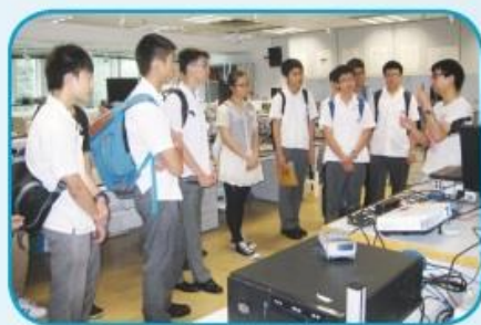
同學參觀香港浸會大學理學院開放日，專心聆聽導賞員的講解。