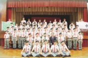
中一課後學習活動——制服隊伍