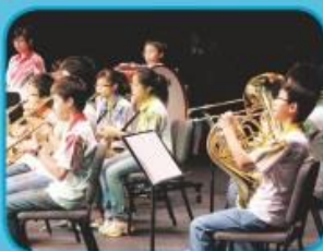
發展藝術教育，為新學制下的「其他學習經歷」作準備。