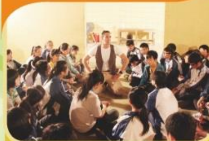
學生參加國際救援機構學習活動。