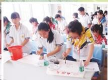
初中「同根同心」境外學習，到陽江與關山月學校學生一同上國畫課，生生交流畫水仙。