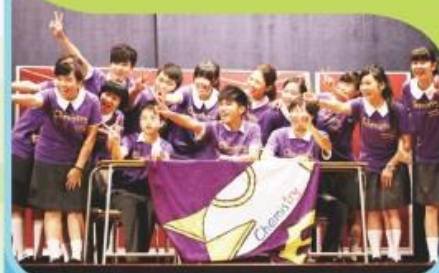
中五學生於綜藝表現中，發揮創意及學習協作解難。