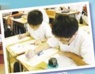
中一課後學習活動—— 英語基礎班 (Back-to-Basics Programme)