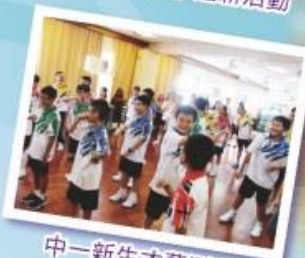
中一新生才藝測試