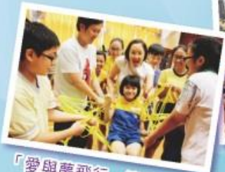
「愛與夢飛行」迎新活動