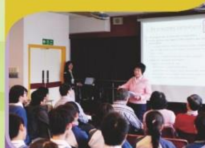
校董利用網絡，廣邀社會人士為學生提供職場裝備訓練。