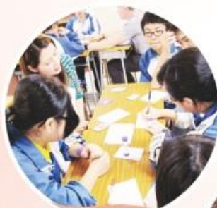
每天午膳時間於英語室均舉行趣味英語活動