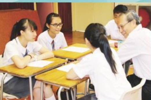
校董為高中學生提供模擬英語面試訓練。