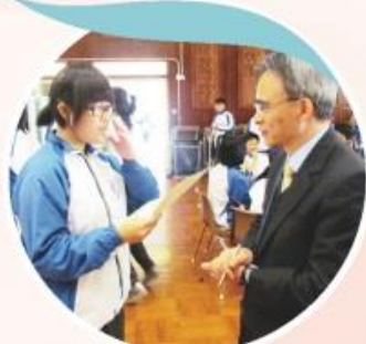
校長也來支持參與英語日活動