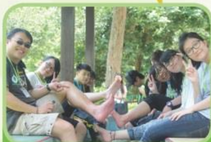
師生一同參與沙巴生態考察團，一起在波靈溫泉浸腳。