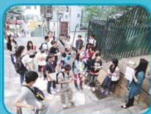
中文科與中文大學合作舉辦「香港文學考察」活動，師生一同到上環來個文學散步。