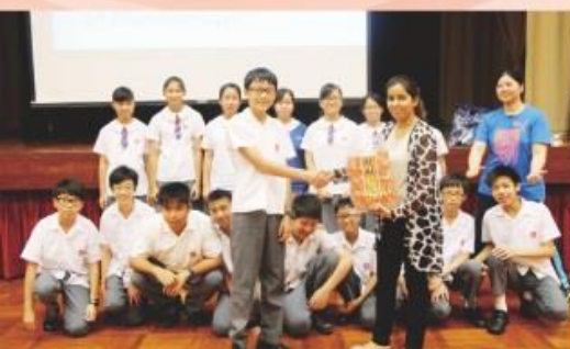
中一同學認真參與英文廣告片製作比賽