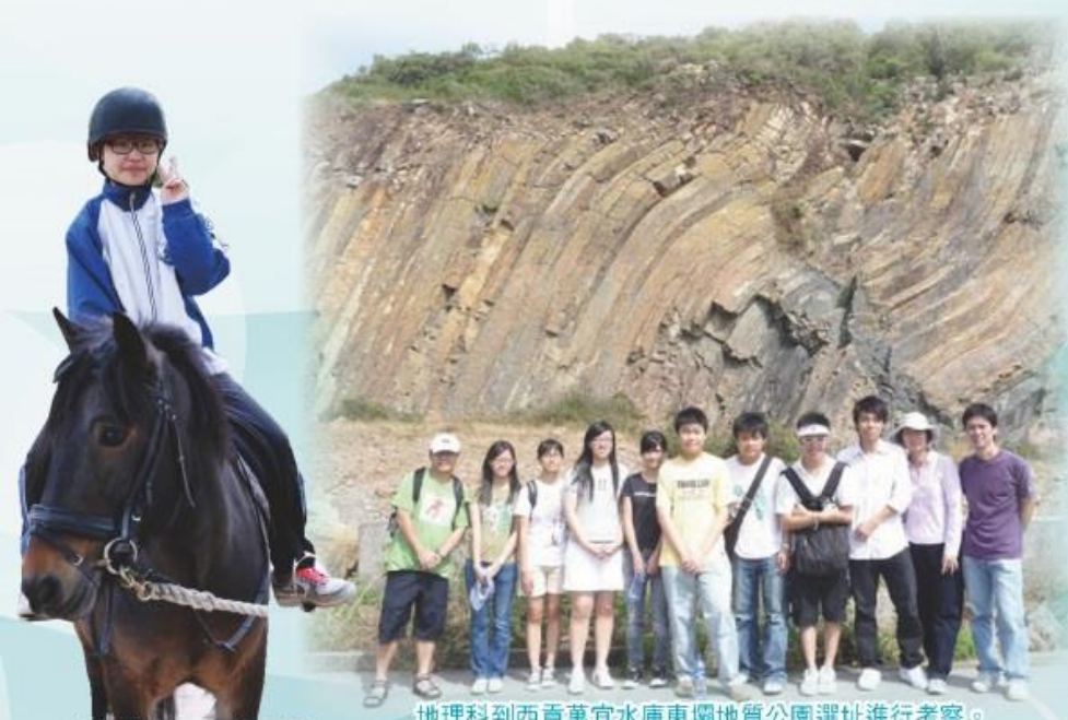
學生參觀屯門騎術學校，並體驗策騎小馬之樂趣。