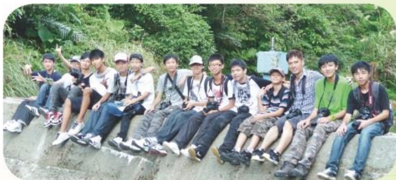
本校環保大使往臺灣參加生態交流團，於基隆市郊尋找河谷蝴蝶時留影。

本校向來鼓勵學生多作學術交流，近年推薦不少學生參與不同類型的交流活動，學生得以擴闊視野，獲益良多。