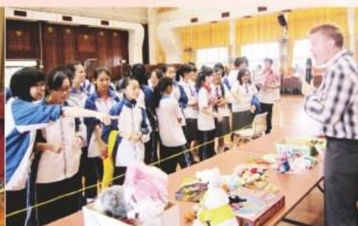
學生投入參與各項英語日活動