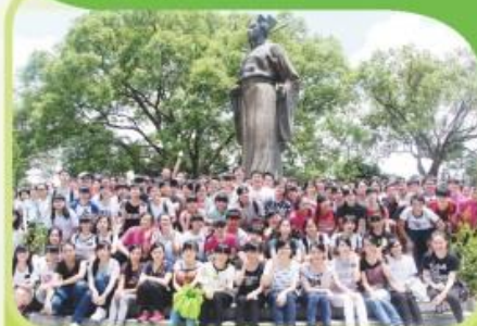
中五學生進行新界文化考察遊，親身感受源遠流長的本土文化。