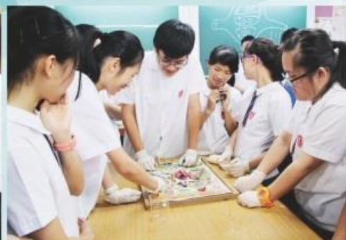
科學周活動之一：同學於生物實驗室進行白老鼠解剖實驗。