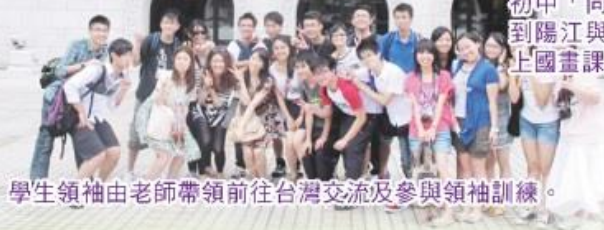
學生領袖由老師帶領前往台灣交流及參與領袖訓練。