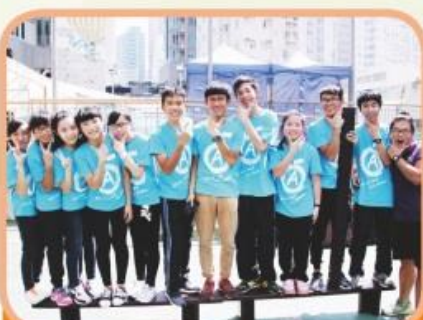
中四學生參加「歷奇學習營」，為適應高中學段作準備。