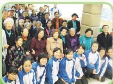
學生由班主任帶領，籌辦社會服務活動，除擴闊視野外，亦增加師生互相的了解。