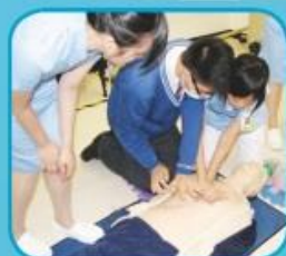
帶領學生參觀護士訓練學校，讓學生認識多元出路。