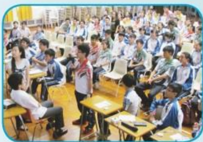
數學科為中二級學生舉辦「計算機比賽」，予同學一顯身手之機會。