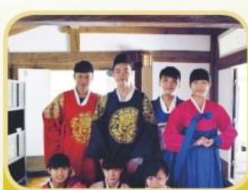
學生參加韓國領袖學習團，一起穿上傳統韓服拍照。