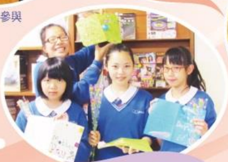
於不同節日—例如母親節—舉辦英語心意咭製作坊