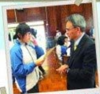
校長也來支持參與英語日活動