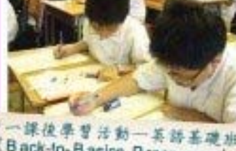
中一課後學習活動—英語基礎班 (Back-to-Basics Programme)