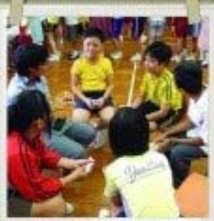
為小六升中一之學生舉辦英語銜接課程