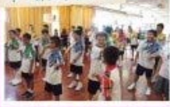
中一新生才藝測試