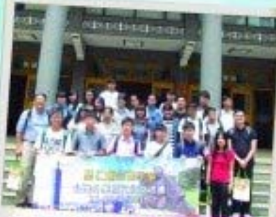
老師率領學生參與台灣升學及文化交流團。