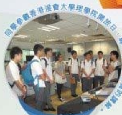
同學參觀香港浸會大學理學院開放日，專心聆聽專業人士的講解。