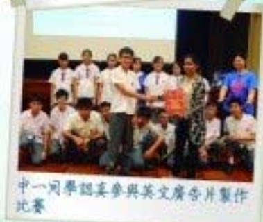
中一同學認真參與英文廣告片製作比賽