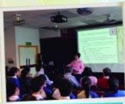
繪畫訓練網絡，歡迎社會人士為高中學生提供職場裝備訓練。