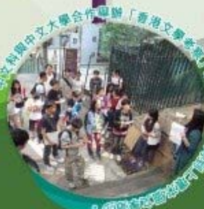
中文科與中文大學合作舉辦「香港文學之旅」活動，讓同學一睹香港文學之風采。