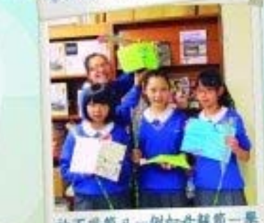
於不同節日—例如母親節—舉辦英語心意咭製作坊