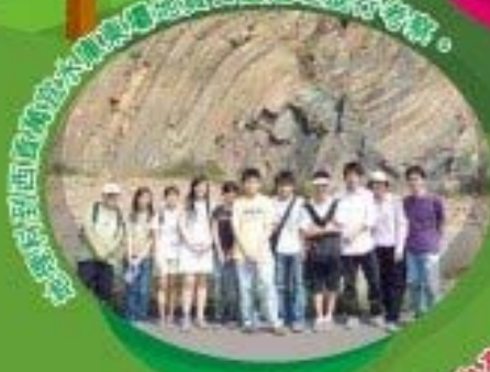
同學到西貢郊野公園與地質公園進行考察。