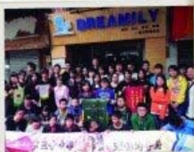
學生參加「躍動的音符」廣州音樂交流活動，與當地音樂團體交流心得。