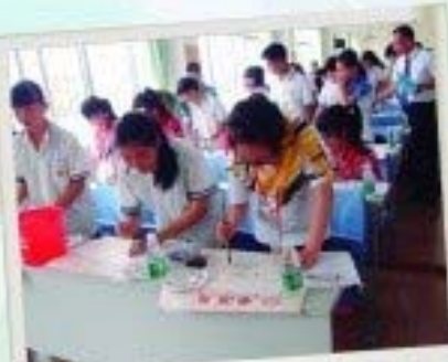
初中「同根同心」境外學習，到揚江蘇鎮山莊學校學生一同上課實踐，在交流中盡承傳。