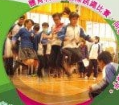
體育科舉行班際跳繩比賽，同學展現傳文之美。