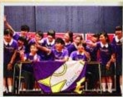
中五學生於繪藝表演中，發揮創意及學習協作精神。