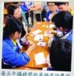
每天午膳時間於英語室均舉行趣味英語活動