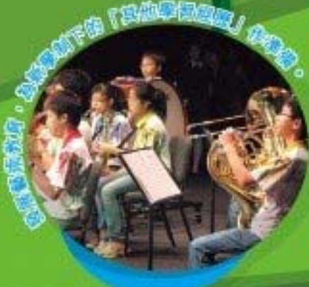
同學參加校內、外樂隊演出「音樂學習之旅」活動。