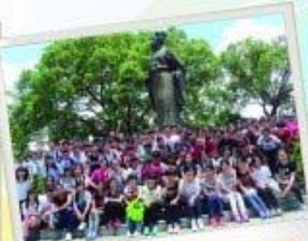
中五學生進行新界文化考察營，親身感受源遠流長的本土文化。