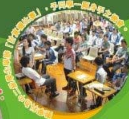
同學參與「社會實踐」，學習第一線身學之經驗。