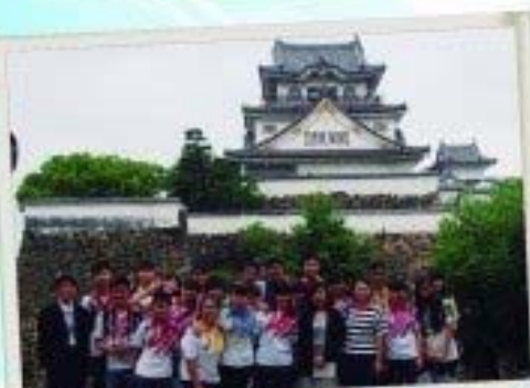
學生參加日本領袖學習團，並於當地名勝留下倩影。