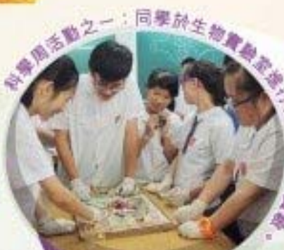
科學周活動之一：同學於生物實驗室進行白晝區別實驗。