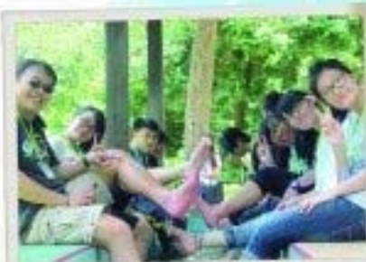
師生一同參與沙巴生態考察團，一起在欣賞美景之餘。