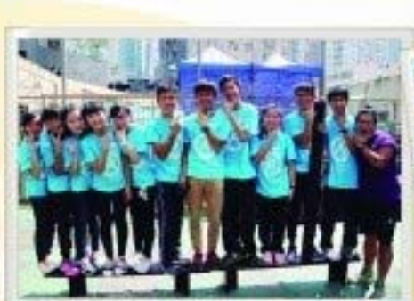
中四學生參加「歷奇學習營」，為遠處高中畢業作準備。