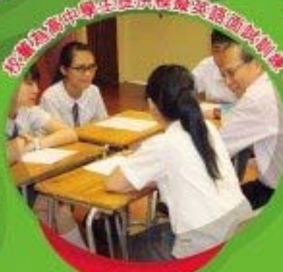
校務為高中文學生提供優質英語面對面。