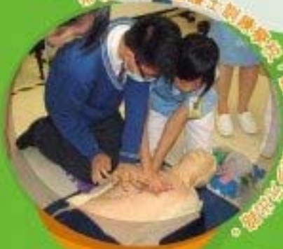
帶領學生參與博士訓練研究，讓學生與老師共同探討。