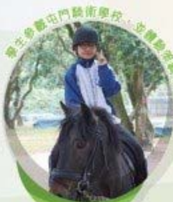
學生參與專門騎術學校，在訓練老師指導下與之共融。