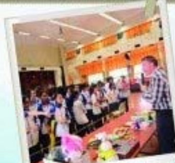
學生投入參與各項英語日活動