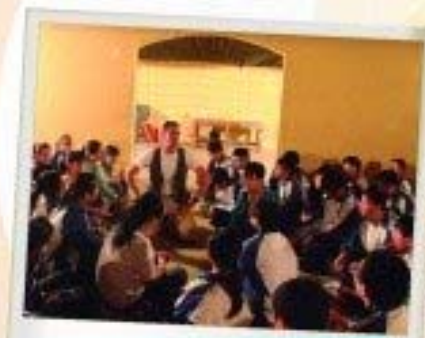
中三學生參加國際校校旗操學習活動。