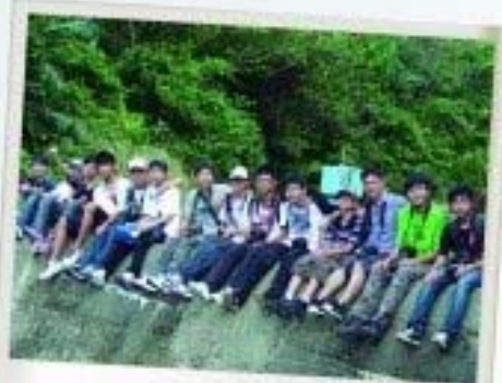
本校環保大使往臺灣參加生態交流團，於基隆中郊尋找河谷湖蝶稀罕影。

本校 向來鼓勵學生多作學術交流，近年推薦不少學生參與不同類型的交流活動，學生得以擴闊視野，獲益良多