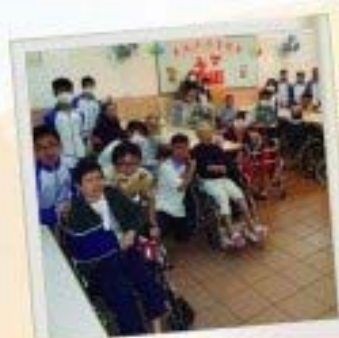
學生由協主任帶領，籌辦社會服務活動，增闊視野外，亦增加師生互信的了解。