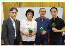
校長(左一)與 Junior English Workshop 義務導師合照

暑假開始了，對部分同學而言，這將會是一個悠長的假期，但對於學校，對於老師，對於很多同學，學習並沒有因假期而停止。我每天回校，碰面都是學生，他們都會用暑假，繼續學習。本年度入讀的中一新生，在這段期間參與了中一的迎新活動及暑期英文班。他們不但提早互相認識，更能及早適應中一的生活。在芸芸回校的學生當中尚有參加了初中興趣班、各級中文、英文精進班、增潤班的，亦有參與了中四其他學習經歷的，而最多的要算是中五的同學，因為老師的不辭勞苦，為他們安排了密密麻麻的補課，讓他們能應付中學文憑試作好準備。