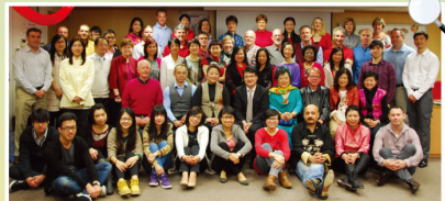
NET Section 是世界英文教育大家庭的縮影

今年能與來自不同地區的英文教學專家共事，學習不同的教學法和文化，擴闊了我的眼界，更令我知道：學得愈多，愈覺得自己是何等的渺小和無知！是次經驗讓我明白終生學習是十分重要的。