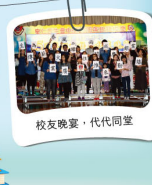
校友晚宴，代代同堂