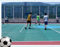
社聯足球比賽向來深受男同學歡迎