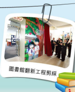
圖書館翻新工程剪綵