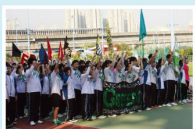
四社健兒於陸運會的開幕禮中誓師

時至今日，四社發展愈趨成熟，除繼續秉承傳統，籌辦過往具特色的活動，如往年陸運會中的啦啦隊表演大賽和於試後活動期間舉辦的歌唱比賽外，亦會開拓創新，舉辦新穎吸引人的活動，以豐富同學們的校園生活。