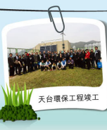
天台環保工程竣工