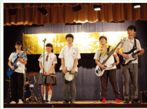
每年舉辦的四社歌唱比賽是讓同學發揮音樂才華的平台