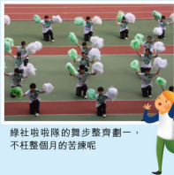
綠社啦啦隊的舞步整齊劃一，不枉整個月的苦練呢