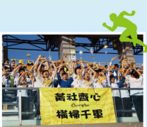
黃社啦啦隊於陸運會比賽中奮力以赴為參賽的健兒打氣