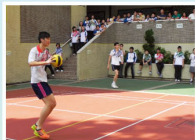
社聯閃躍足球比賽吸引不少師生駐足觀看