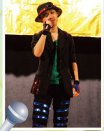
看！同學的精心打扮，只為在四社歌唱比賽中獻贈一場精彩的演出