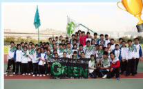
綠社奪得陸運會「全場總冠軍」外，在各項的社聯比賽也成績驕人，憑著各幹事和社員互相合作，共同努力，於本年度更獲得「最佳之社」的榮譽，寫下輝煌的一頁