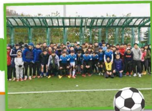
本校男子甲組足球隊於葵青區學界(甲二組)足球比賽獲得亞軍