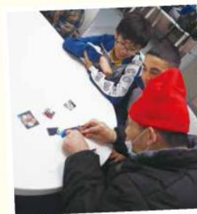
學生與長者一同進行小遊戲

為學校和學生帶來的正面影響：在服務計劃中，我們觀察到學生各方面不同的改變。在認知上，他們對服務對象的生活及能力，有重新認識的機會，改變了他們心中一些負面的想法及印象。在技能上，他們明白到團隊合作的重要性，亦學習到與服務對象相處的技巧。在態度上，他們表示願意接納弱勢社群，並希望繼續參與義務工作，幫助他們融入社會。