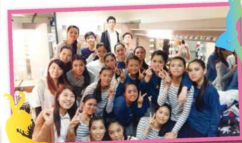
本校舞蹈校隊成員獲得第廿九屆葵青區舞蹈比賽青年組金獎