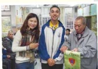
探訪明愛樂和宿舍