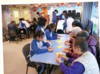
長者分組參與學生創作的小遊戲

在歷年的服務計劃中（2003-2016），我們曾帶領學生接觸不同的群體，他們的服務計劃包括：探訪安老院或日間老人中心的長者、幫助獨居長者清潔家居、探訪智障人士工場、到特殊學校籌劃賀年攤位遊戲、探訪唐氏綜合症的兒童、與輪椅人士一同參與歷奇活動等等。