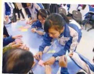
學生帶領長者一同參與手工藝創作