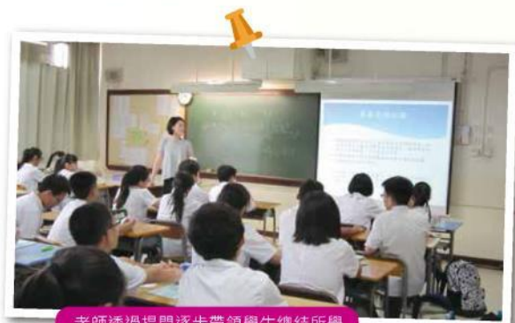
老師透過提問逐步帶領學生總結所學

除了筆記和總結技巧，我們亦帶領學生參與提升課堂專注力的活動。小學升上中學有很多改變，其中一樣是在課堂的心態和專注變得更加重要。如學生沒有積極的學習心態，正面的上課態度和聚精會神的聽課習慣，很易追不上中學深和廣泛的課程。因此，我們帶學生參與提升專注力和心態的活動，協助他們反思和分析自己過往的專注程度和能力，檢討不專注的原因並作出改善建議，共同探討加強專注的方法。同學經過專注課的體驗，都能提升對專注力的認識和作出改善。