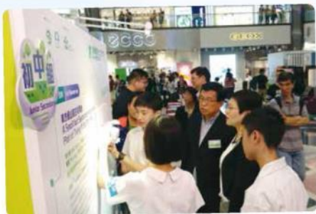
香港特別行政區政府環境保護署署長王倩儀太平紳士在聆聽同學講解作品

該地盤面積只有6,200平方米，住宅需向高空發展以騰出空間建設社區公園。同時，地段背山望海，住宅大樓被設計成階梯狀建築，具有高採光率及空氣流通的優點之外，亦能把各層的景觀極大化。中層空出建空中花園，讓居民有一舒適環境休憩及聯誼。為了讓住宅大樓能融入周邊的自然環境，除在外牆進行垂直綠化外，更利用天橋把住宅連接至後山的細山路步行徑，鼓勵居民親近大自然。