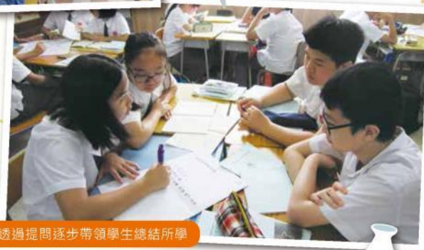
老師透過提問逐步帶領學生總結所學