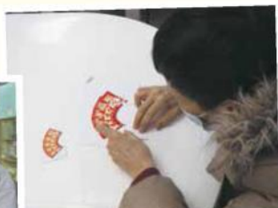
學生籌劃與賀年相關的小遊戲