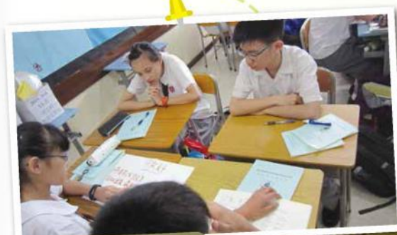
同學聚精匯神地總結一週所學