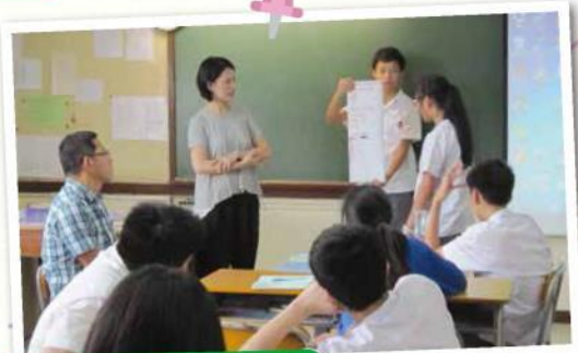
同學向全班匯報總結後的心得