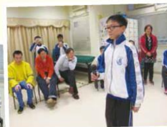
學生司儀講解活動流程