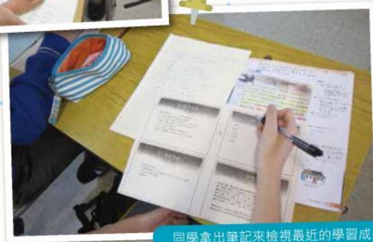
同學拿出筆記來檢視最近的學習成果