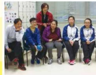
學生籌劃遊戲，與受助者同樂