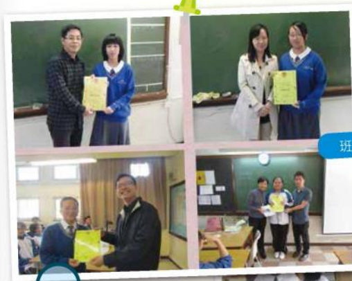
班主任頒筆記獎項予得獎學生