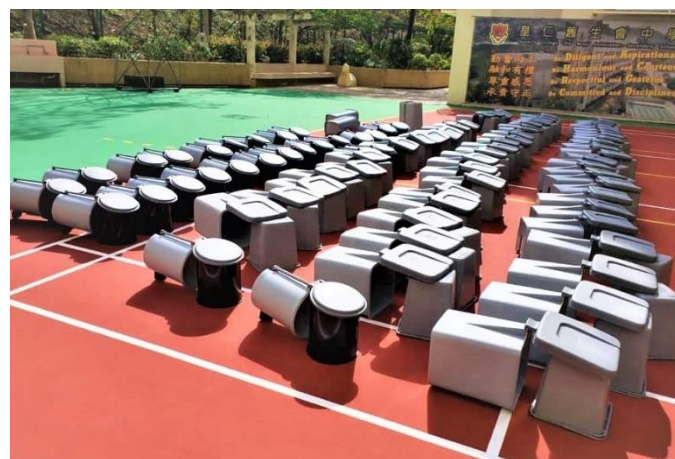
增購有蓋垃圾桶供師生在不相同地點使用。