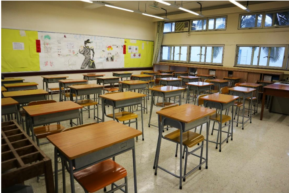
課室的學生桌椅已改為單行排放，並盡量利用空間來保持距離。

為提醒同學在洗手間或小賣部等公用空間排隊時須保持適當的社交距離，學校在這些地方也貼上標示，讓同學有所依從，清楚保持人際距離。此外，學校也會讓學生按班級分不同時段小息，避免操場或校內共用空間過於擠迫；當然，同學亦須聽從指示及耐心配合！