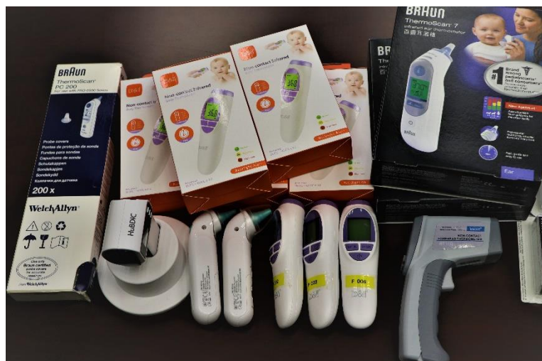
不同類型探熱計，方便師生量度體溫。

而防疫更需注意雙手清潔，學校在洗手間會提供洗手液。而在學校大門及課室均有搓手液供同學清潔雙手。並已購換百多個有蓋垃圾桶放置於不同地點， 希望同學善用，一同守護公共衛生。