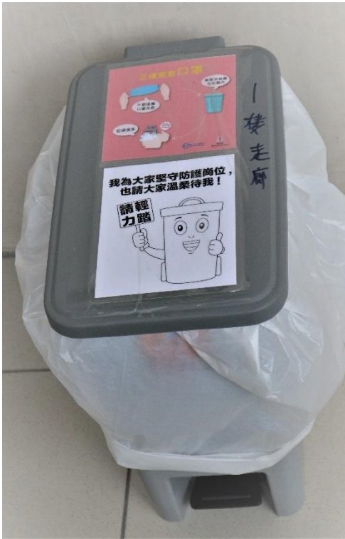
垃圾桶上已提示同學如何棄置口罩。

為加強同學的防疫意識，學校已在當眼處及壁報板貼上手部衛生、咳嗽禮儀等健康及衛生資訊，提示同學應加強留意個人健康及注重公共衛生， 希望大家合力營造一個健康校園，不但「正面·對疫」，更要共同抗疫，最後戰勝病疫。