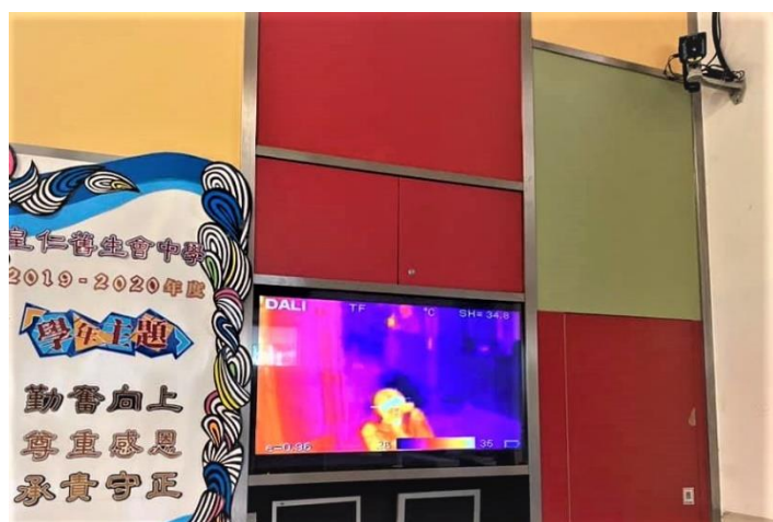
學校年前已於大門口設有熱能探溫計！