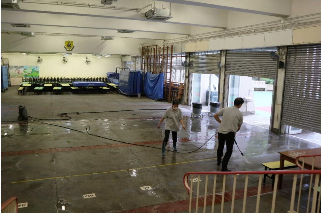
工友積極進行校舍清潔工作。

學校工友已加緊為校舍進行清潔及消毒工作，如使用 1 比 99 稀釋家用漂白水清潔消毒校園，包括課室、特別室、小賣部、洗手間等，確保校園清潔和衛生。此外，為防止「2019 冠狀病毒病」在校園散播，學校已按衛生防護中心建議停止使用飲水器。