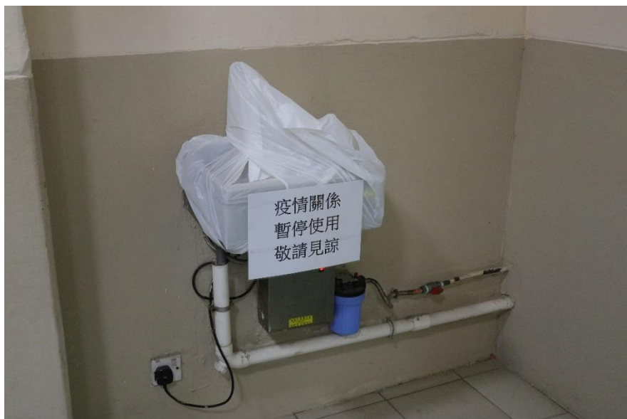
按衛生防護中心建議停止使用飲水器。