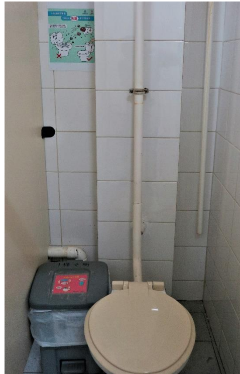
洗手間內有提示正確沖廁程序。