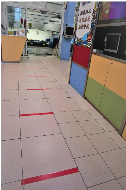
排隊到小食部，同學們須保持社交距離。