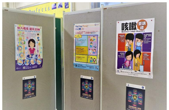
不同的壁報，一樣的提醒！