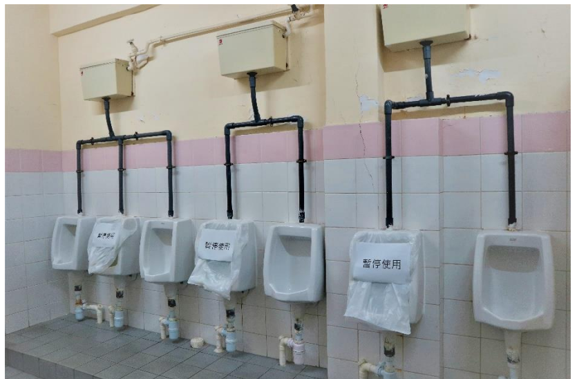
同學使用洗手間時也須耐心配合社交距離新措施！