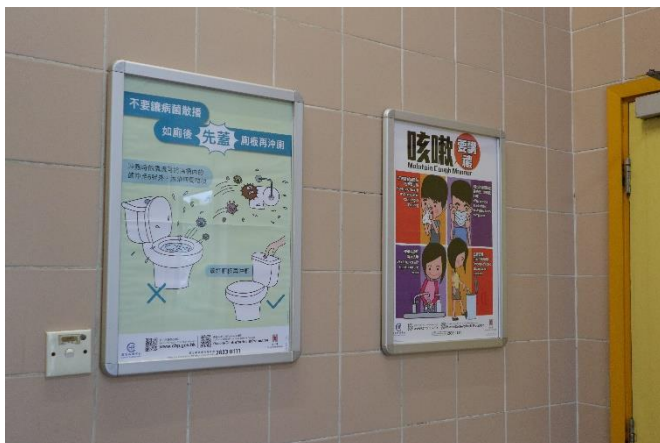
為己為人，同學須注意公共衛生！