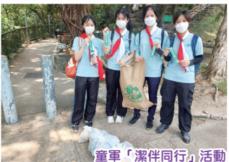
童軍「潔伴同行」活動