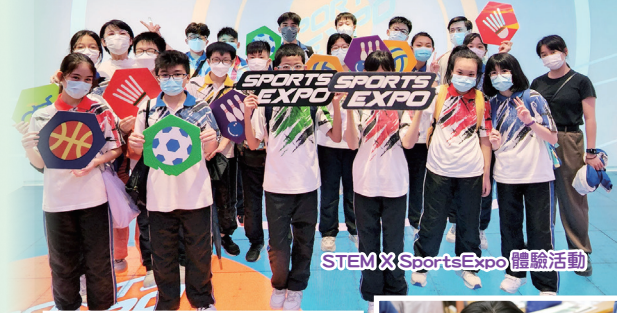
STEM X Sports Expo 體驗活動