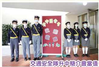
交通安全隊升中簡介會當值