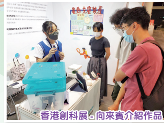
香港創科展，向來賓介紹作品

課程持續發展 - 學校不斷累積課程發展經驗，推動 STEM 教育向持續發展方向改進，按學校自身的優勢，融入不同科目、課內外學習活動之中。