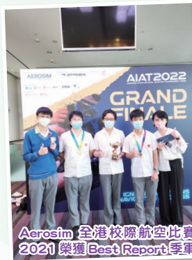
Aerosim 全港校際航空比賽 2021 榮獲 Best Report 季軍