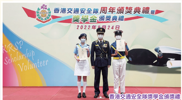
香港交通安全隊獎學金頒獎禮