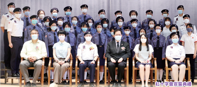
紅十字會宣誓典禮

學 校現有四支制服團隊：童軍、紅十字會、交通安全隊及航空青年團，讓學生通過團隊訓練活動及社會服務，學習生活技能、培養個人興趣及品格，提升他們的責任感、紀律、自信心等，發掘學生的無限潛能，擴闊世界視野，並於未來回饋社會。