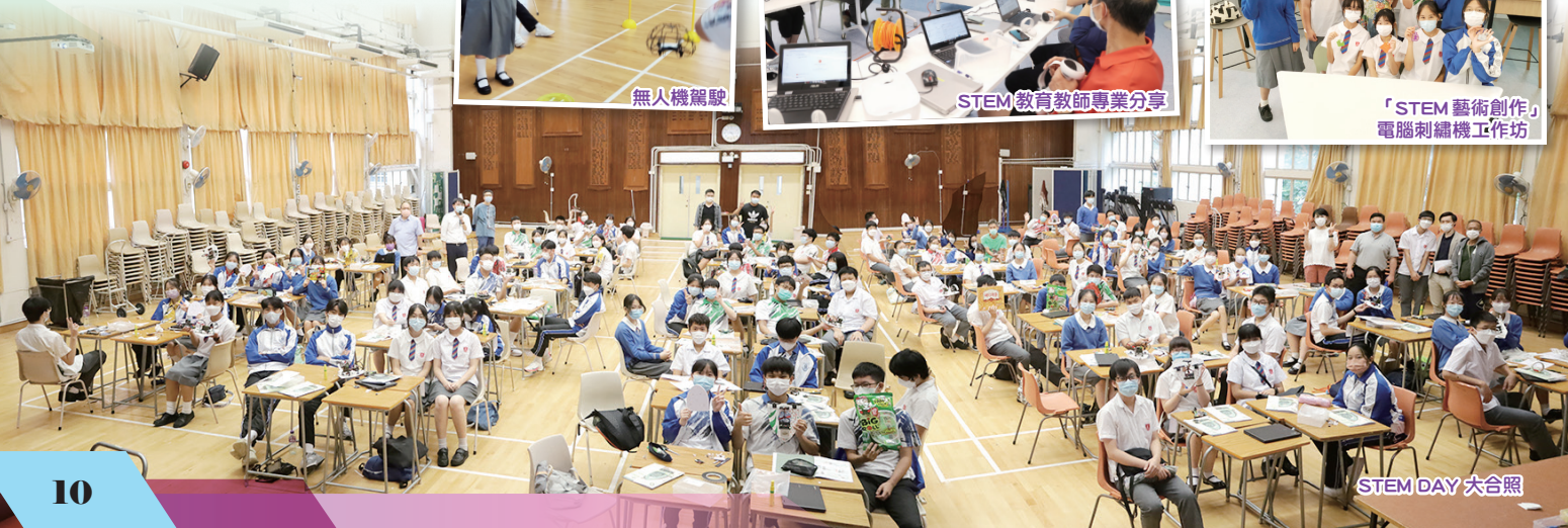
STEM DAY 大合照