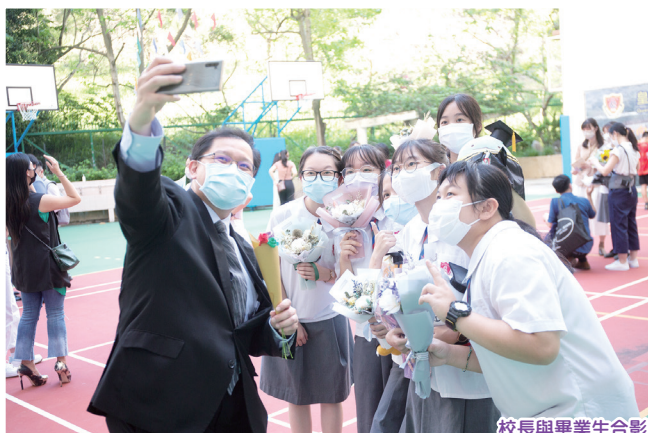
校長與畢業生合影

校友會回饋母校，連續十多年舉辦英文面試工作坊，教導學弟妹面試技巧，亦以英語分享他們的職場經歷，為學弟學妹未來升學求職做好準備。許校長談及「重學歷也重經歷」：「我們學校的老師很喜歡帶著學生『周圍去』！」除了出席英文電台節目外，也會到不同的地方進行參觀考察活動，如過去曾到訪迪士尼樂園、愉景灣、民航處等。透過與外國人交流溝通，增強學生英語「聽」與「說」的信心。