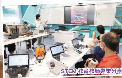
STEM教育教師專業分享