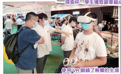
使用VR眼鏡了解鸞的生境