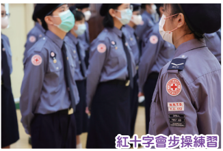
紅十字會步操練習