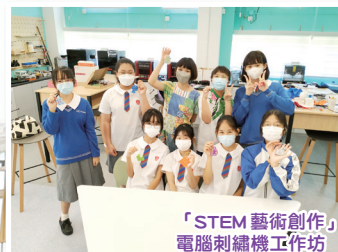
「STEM藝術創作」電腦刺繡機工作坊