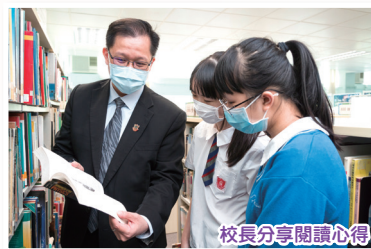
校長分享閱讀心得

學校不時邀請老師主持「老師愛閱讀」環節，向學生推薦好書以及分享閱讀心得，鼓勵學生接觸更多的好書。學校亦舉辦「漂書活動」，師生會「漂」出書籍，讓它們尋找下一位有緣人，推動閱讀氣氛之餘亦能為環境保護出一分力。