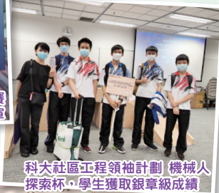
科大社區工程領袖計劃 機械人探索杯，學生獲取銀章級成績