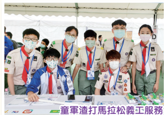
童軍渣打馬拉松義工服務